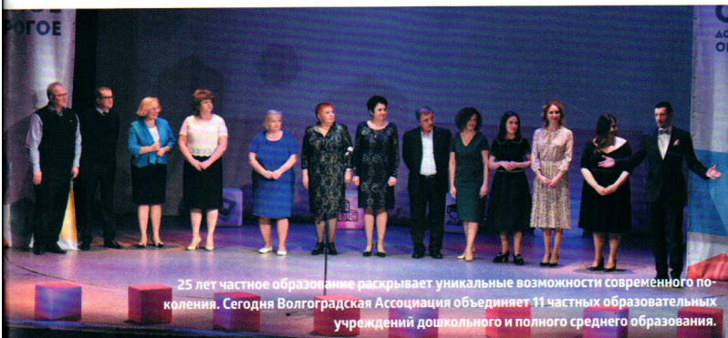
25 лет частное образование раскрывает уникальные возможности современного поколения. Сегодня Волгоградская Ассоциация объединяет 11 частных образовательных учреждений дошкольного и полного среднего образования.

Дошкольный возраст является самым ценным периодом жизни человека, который определяет его будущее. В данный момент существует много инновационных методик, которые могут быть качественно реализованы только в рамках частного образования.